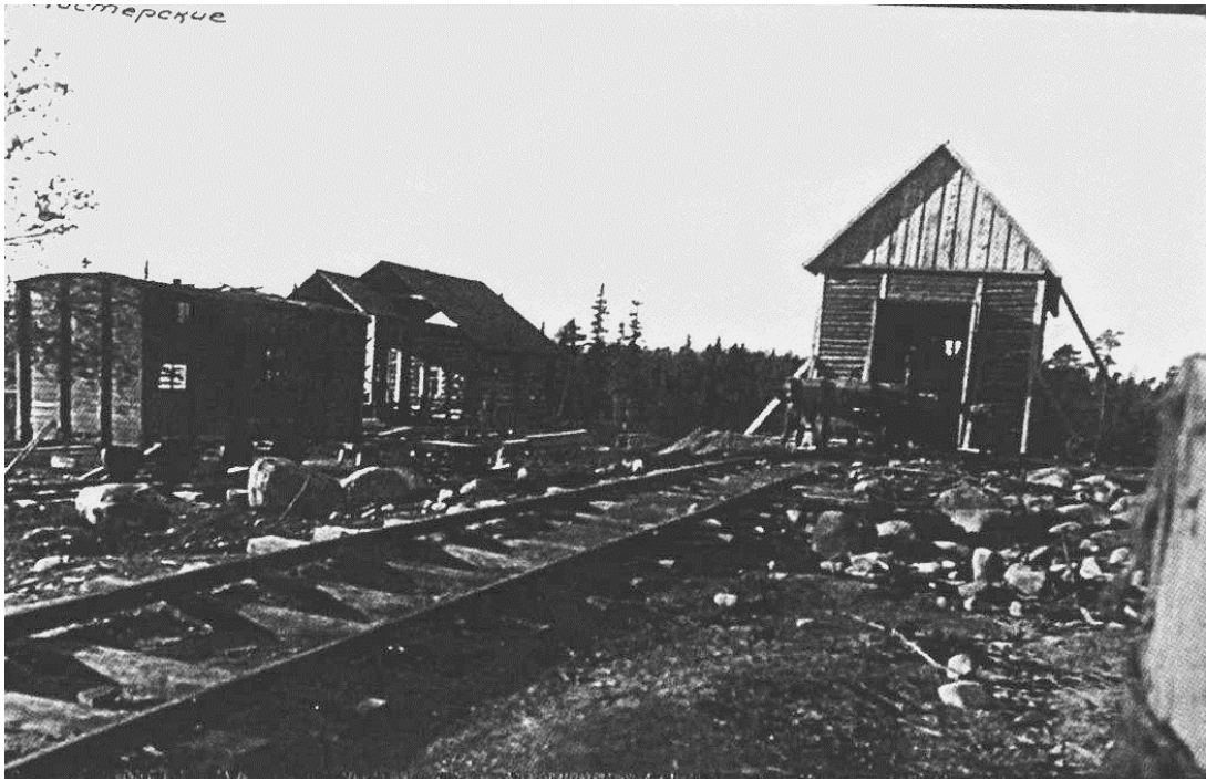
Фото № 32. Строительство «железнодорожного городка». Фото до 1928 г.